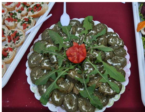
Slika broj 42: Jela od žučenice

Izvor: http://www.google.me/search?q=žučenica&biw