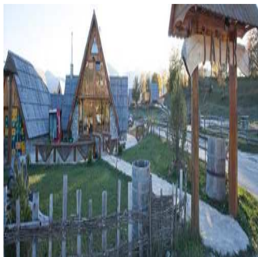
Slika 45: Izgled etno sela Jatak

Etno selo Jatak smješteno je u selu Pošćenje, 7 km od Šavnika, na južnoj strani Durmitora u kojoj se nalazi kanjon Nevidio. Tu je i Pošćensko jezero koje svojom živopisnom ljepotom čini selo jednim od najljepših u Republici. Nevidio je najatraktivniji kanjon na Balkanu, a poslednji osvojen u Evropi. Svakodnevno ga posjeti oko stotinak ljubitelja ekstremnih sportova. U selu postoji više biciklističkih staza za popularni planinski biciklizam. Pored planinskog biciklizma ovaj predio dopušta turisti da se rekreira uz predivne pejzaže kao što su 2 seoska jezera, rijeka Komarnica, kanjon Pridvorice, a sve to uz izvorsku vodu, domaću hranu i čist vazduh. Južna strana planine Durmitor pravi je izazov za ljubitelje alpinizma. Sadržaj etno sela čini 9 bungalova, restoran je napravljen u etno stilu, savardak takođe od drveta i kamena.