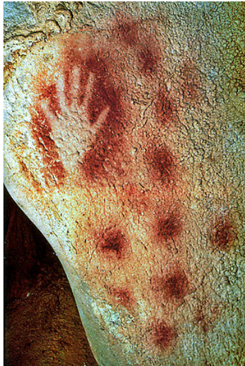
Slika 3: Otisak ruke iz pećine u Francuskoj koji je znak "moje" 35.000g. pne.