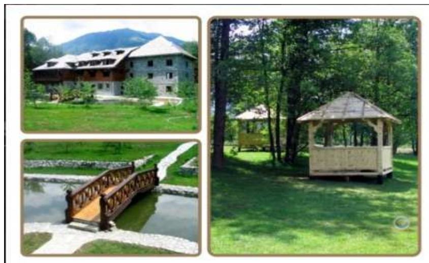
Slika broj 44: Etno selo Komnenovo