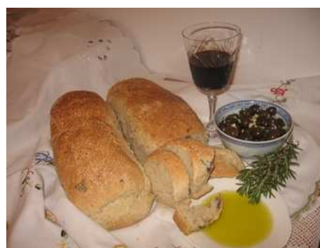
Slika broj 40: Hleb sa maslinama i maslinovim uljem