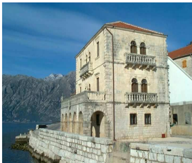
Slika 16: Palata Bujović

U Perastu danas postoji 19 palata baroknog stila iz perioda od 17. do 18.vijek: Palata Bujović, jedna od najljepših baroknih zgrada na cjelom primorju, djelo već pomenutog arhitekta Giovanni Batiste Fontane iz Venecije; Palata Lučić-Kolović-Matikola, Palata Bronza, Palata Balović, Palata Vukasović-Kolović, Palata Brajković-Martinović, Palata Smekja, Palata Visković, Palata Mazarović, Palata Zmajević (poznata je kao biskupija jer su u njoj stolovala dva biskupa Andrija i Vicko Zmajević).