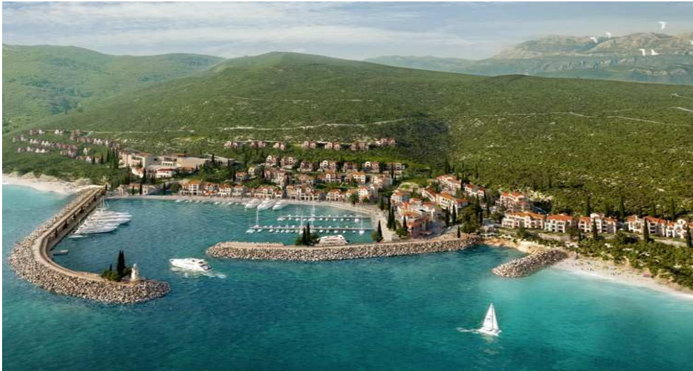
Slika 22: Luštica Bay projekat

Osim projekta “Luštica Bay” na području Kumbora realizuje se takođe kapitalna investicija, a to je projekat “ PortoNovi ”. Herceg Novi grad poznat po skalinama i mimozi, uskoro će dobiti još jedno, posve drugačije obilježje. Tradiciju mirnog obalskog grada upotpuniće jedinstven, luksuzni turistički kompleks Portonovi, koji će Herceg Novi označiti na mapi najpoželjnijih svjetskih destinacija. Ovaj projekat, vrijedan preko 500 miliona eura, pozicioniraće crnogorsku obalu uz Kapri, Monte Karlo, Porto Fino i Azurnu Obalu.