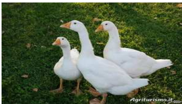
Slika broj 30: Domaće životinje na gazdinstvu