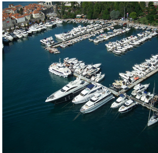
Slika 20 i 21: Budva „metropola turizma“ i Marina Budva

Veliki uticaj na razvoj nautičko-turističke ponude imaju saobraćajni ili komunikativni elementi. Saobraćajna infrastruktura, odnosno njegova razvijenost uslovljena je stepenom razvoja privrede. Kvalitet naših saobraćajnica je jedna od najvažnijih karika u lancu ponude, jer nautički turista će imati želju da upozna i ostale djelove Crne Gore, ne samo primorje. Zbog loše ekonomske