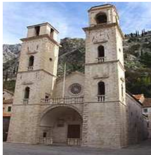
Slika 9: Katedrala sv. Tripuna, spomenik kulture zrele romanike (809.- 1166.g.)

Izvor: https://sh.wikipedia.org/wiki/Romanika