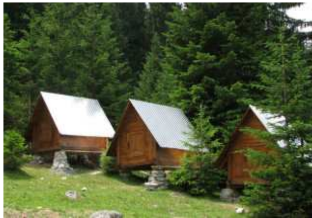
Slika 53: Eko planinsko naselje Hrid