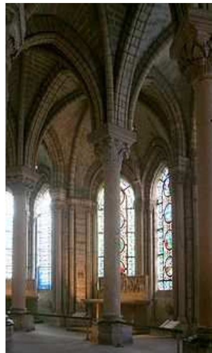
Slika 13: Unutrašnjost prve gotičke katedrale St. Denis opata