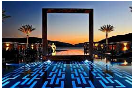
Slika 18: Mol za megajahte u Porto Montenegro