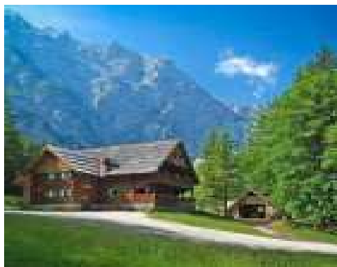
Slika br 34: Planšarija

Standardi kvaliteta u Sloveniji koji čine minimalni uslov za kategoriju (klasifikaciju), propisani su zakonom. Znak obilježavanja za turistička seoska porodična gazdinstva je jabuka (jabolka). Gazdinstva se obilježavaju sa 1-4 jabuke (1 jabuka- najniža kategorija; 4 jabuke- najviša kategorija). Oznaka kvalitete (klasifikacija) odnosi se na opremanje smještajne jedinice ili objekta. Minimalnim uslovima obuhvaćeni su i dodatni sadržaji na gazdinstvu (prvenstveno za kategoriju 4 jabuke). Tako su npr minimalni uslovi za kategoriju 1 jabuka: jednostavno uređene sobe sa zajedničkim kupatilom i sanitarnim čvorom. Standardizaciju sprovodi država – nadležno ministarstvo. Kontrola se vrši svake tri godine. Turistička seoska porodična gazdinstva organizovana su kroz profesionalno udruženje seoskog turizma Slovenije: Zduženje turističkih kmetij Slovenije.