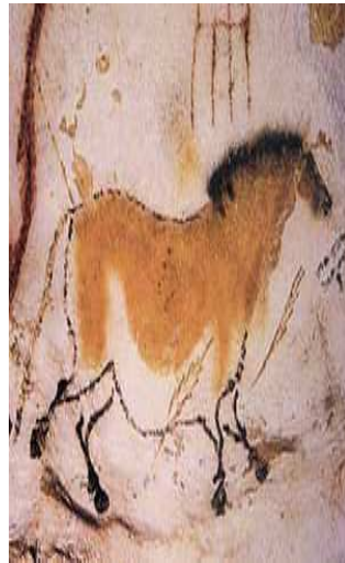
Slika 4: "Kineski konj" iz pećine Lasko u Francuskoj 14,000g.pne.