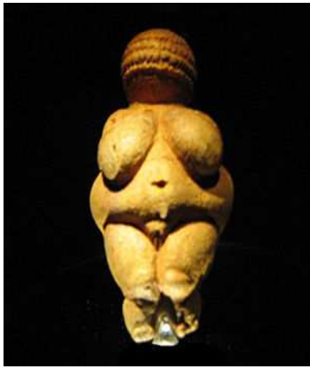
Slika 1: Venera iz Vilensdorfa