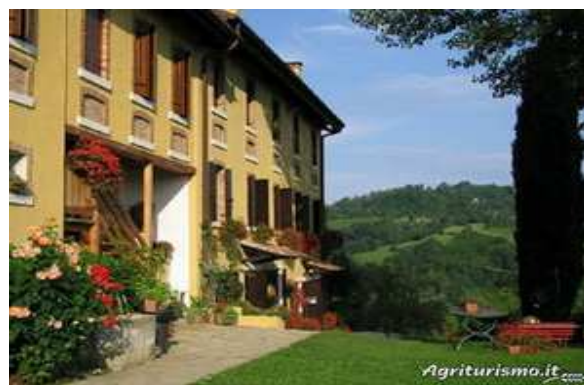
Slika broj 27: Izgled domaćinstva Le Noci