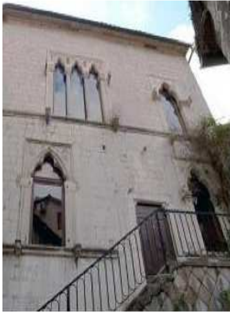
Slika 14: Palata Drago u Kotoru, iz 15. vijeka