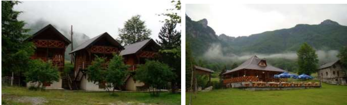
Slike: 54 i 55: Ljepote eko katuna Grbaje

Eko katun Grbaje se nalazi u prelijepoj dolini Grebaja, u podnožju Prokletijskih vrhova. Radi samo u ljetnjoj sezoni, tačnije sa radom počinje od 1 maja. Raspoaže sa 32 ležaja, smještenih u bungalovima a cijena je 8e po ležaju.