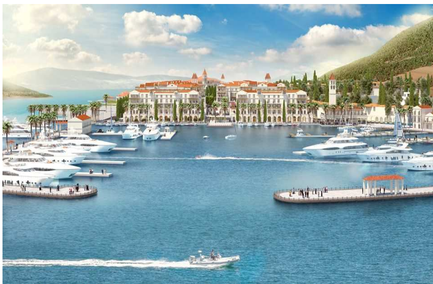
Slika 23: Projekat Porto Novi, Izvor: https://www.google.me/search?q=projekat+porto+novi&biw

Savremeni turisti u bijegu od brzog i stresnog urbanog načina življenja, putuju u neotkriveno, mistično i tiho mjesto, daleko od gradskih i saobraćajnih gužvi. Putuju da bi upoznali nove kulture, zbog obrazovanja, zdravlja, rekreacije, pri čemu traže stalne inovacije proizvoda koje su praćene njihovim emocijama i doživljajima za novim iskustvima. Profil novog turista ima sledeće karakteristike: