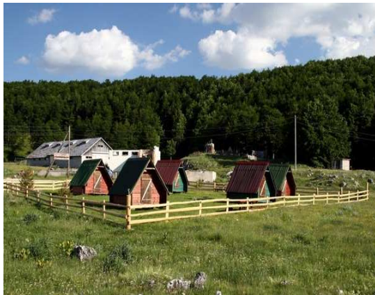
Slika 52: Etno selo Milogora

Sigurno ne postoji čovjek koji je putovao Pivom, a da ne poznaje ovaj etno kraj na Trsi, gdje se obavezno svraća na okrepljenje, dobar zalogaj i pivo iz sniježnice. Već nekoliko godina turistička ponuda ovog mjesta dopunjava se organizovanjem atraktivnih izleta Durmitorom i Pivom, Tarom i jezerom, smještajem u bungalovima, jahanjem. Ogromnim trudom i brigom domaćina i organizatora, ovi pionirski poduhvati u crnogorskom izletništvu mnogo su više od toga-zaista nezaboravna iskustva boravka u prirodi i uživanja u bogatim ljepotama pivsko-durmitorskog kraja. 143