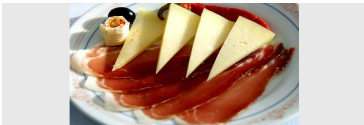
Slika broj 37: Domaći crnogorski autohtoni proizvodi

Crna Gora ima veliku šansu u organskoj proizvodnji bez vještačkih dodataka, čiji je cilj stvaranje visokokvalitetnog proizvoda u sistemu koji ne ugrožava životnu sredinu. U ovoj oblasti su uvedena sertifikaciona tijela, akreditacije i inspekcija i danas 3 agencije rade u Crnoj Gori u ovoj oblasti. Već je 14 proizvođača ispunilo ove zahtjevne uslove i ova oblast proizvodnje će imati najbrži trend razvoja i rasta. 133