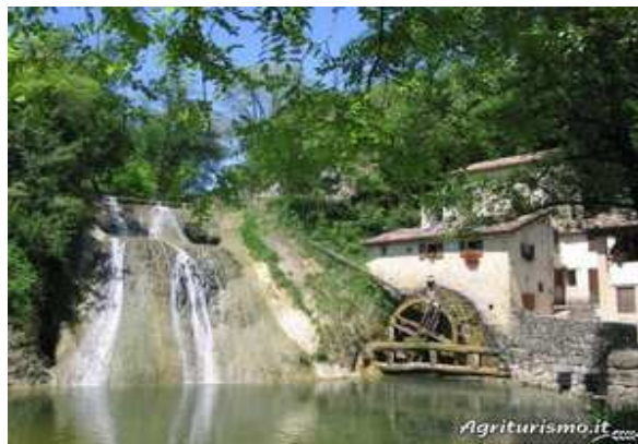
Slika broj 29: Stari mlin u blizini domaćinstva