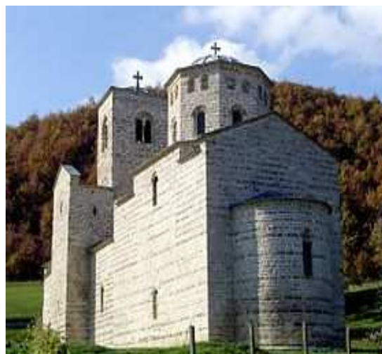
Slika 11: Manastir Đurđevi Stupovi- raško graditeljstvo