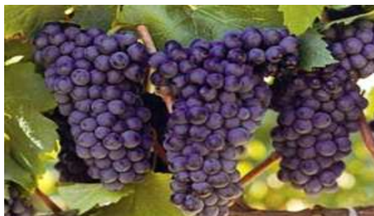
Slika broj 32 i 33: Francuski proizvodi: Vino, sir i grožđe