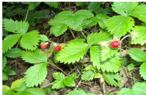
Slika broj 31: Šumske jagode