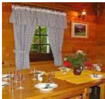
Slika br. 35: Unutrašnjost planšarije