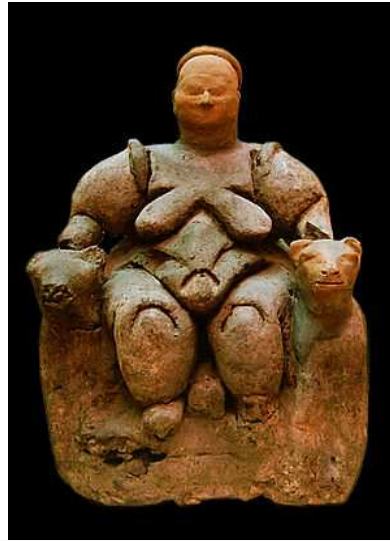
Slika 2: Boginja majka, turski Muzej 5500-6000 g.p.n.e.

Izvor: https://sh.wikipedia.org/wiki/Prahistorijska_umjetnost