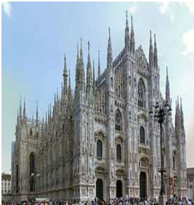
Slika 12: Gotička katedrala u Milanu