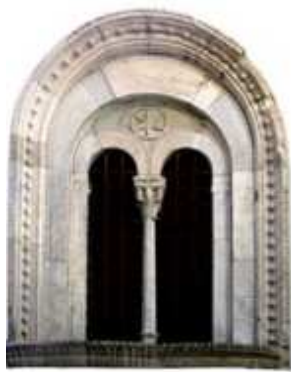
Slika 6: Prozor Bifora

Karakteristike romaničke arhitekture jesu: čvrstoća, masivnost, zatvorenost, jednostavnost, naglašena horizontalnost. Romanika je prepoznatljiva po masivnim zidovima koji nose teret i težinu svoda. 66 Kao novi arhitektonski element u romanici, primjenjuje se rozeta, u početku jednostavno, a kasnije u gotici bogato dekorisan okrugli prozor na fasadama. Prozori su bili veoma mali u odnosu na veličinu građevine. Bili su lučno zasvođeni. Bifore i trifore su prozori koji karakterišu romanički arhitektonski stil, kao i polukružni svodovi.