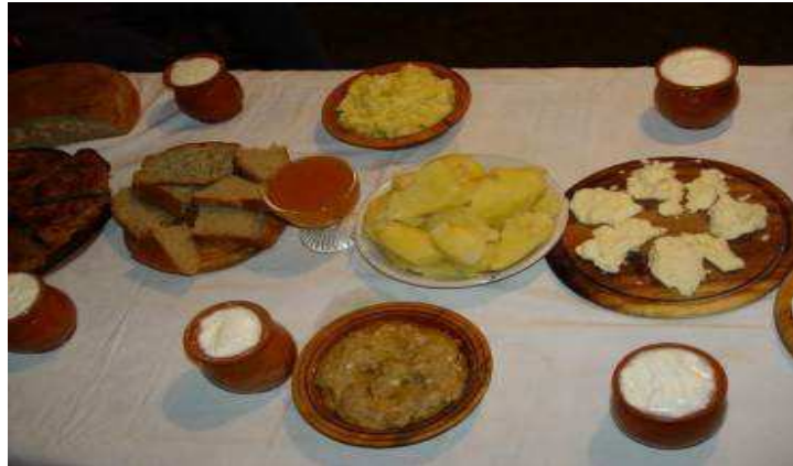
Slika broj 36: Crnogorski eko proizvodi

(gomilanje teških metala, fosfata, nitrata i nitrita u proizvodima, zemljištu, podzemnim vodama). Smanjenje plodnosti zemljišta i njena erozija su dovedeni do alarmantnog nivoa širom svijeta. "Erozija" genetske raznovrsnosti, ogromno korišćenje neobnovljivih izvora energije i mnoge druge negativne pojave stoje pred konvencionalnom poljoprivredom kao nerješivi problemi.