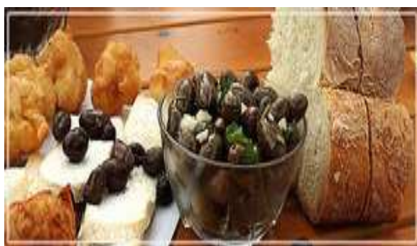
Slika broj 39: Tučene masline

“Žutica” je odomaćena sorta masline, na crnogorskom primorju zastupljena čak 64 %. Gaji se u svim djelovima Boke, a naročito u Luštici, Grblju, Kavču, Gornjoj Lastvi i Stolivu. Ova sorta daje visokokvalitetno maslinovo ulje, a osim za ulje koristi se i za konzervisanje. Tučena je najbolja i taj način pripreme je karakterističan za Boku. 138 Maslinarsko društvo “Boka” ima cilj da oživi sela, otvaranjem novih mogućnosti za zapošljavanje mladih, njihov ostanak i povratak selu. Maslinarski/seoski turizam, kao novi vid turističke ponude treba da doprinese poboljšanju uslova života i rada na selu, kao i odgovarajućem vrijednovanju poljoprivrednog rada i naših tradicionalnih vrijednosti. Od maslina i maslinovog ulja mogu se napraviti različiti proizvodi, a na sledećim slikama možemo vidjeti jela spravljena od maslina, na tradicionalni način.