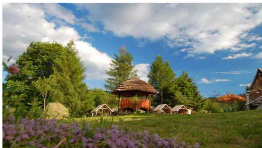
Slika broj 43: Etno selo Brezna

Etno selo Brezna je prvo etno selo u Crnoj Gori koje se nalazi na tridesetom kilometru puta Nikšić – Plužine. Etno selo nudi jedinstven doživljaj netaknute prirode i nalazi se u blizini impozantnog kanjona Komarnice. Raspolaže sa interesantno osmišljenim bungalovima i nacionalnim restoranom Komarnica koji nudi tradicionalna jela crnogorske kuhinje. Takođe nudi i mogućnost raftinga na rijeci Tari, vožnje pivskim jezerom, džip safari durmitorskim prstenom.