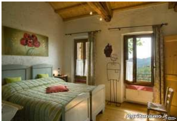
Slika broj 28: Spavaća soba u rustičnom stilu