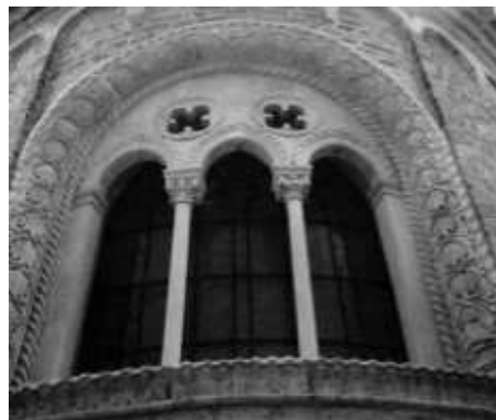
Slika 7: Prozor Trifora