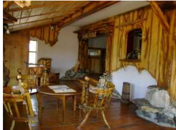
Slika broj 51: Unutrašnji izgled kolibe