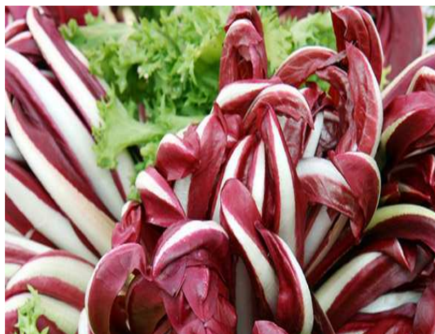
Slika 24: Autohtona vrsta crvene salate iz Treviza