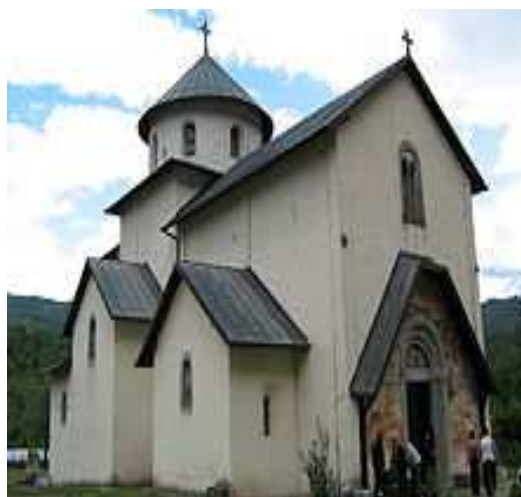
Slika 10: Manastir Morača, primjer raškog graditeljstva

Na sledećim slikama vidimo primjere raškog graditeljstva u Crnoj Gori, a to su manastir Morača i manastir Đurđevi Stupovi kod Berana. Manastir Đurđevi Stupovi izgrađen je 1213. godine i predstavlja zadužbinu Stefana Prvoslava (1174-1244), sina velikog župana Tihomira, najstarijeg brata Stefana Nemanje, čiji grob se nalazi unutar manastira.