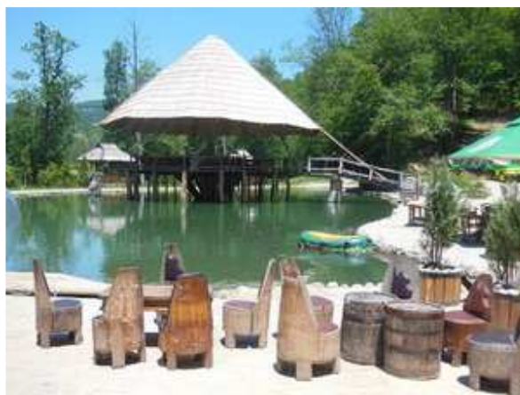
Slike broj 48 i 49: Izgled etno sela Vuković