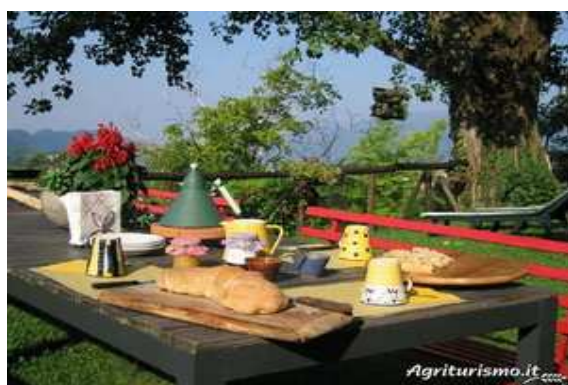
Slika broj 26: Doručak sa domaćim hlebom

Samo u oblasti Treviza nalaze se brojna agroturistička domaćinstva, koja nude gostu ambijent kuća u rustičnom stilu, domaća jela (njoke, lazanje, paštešute, domaće meso na gril kao što je crveni rozbif, prepelice, fazane i ostalu divljač...), a od pića tu su domaća vina iz podruma domaćinstava. Svako domaćinstvo ima svoju plantažu vinove loze gdje je dozvoljena šetnja nepreglednim vinogradima, ribnjake, voćnjake, stare mlinove kao i podrume gdje prave vino i gdje se vrši degustacija. Osim vina tu je i domaća rakija-grappa, a takođe i čuveni italijanski likeri kao što je Limuncello. Mjesto koje pripada okrugu grada Vičence, Bassano di Grappa, upravo je poznato po raznim vrstama domaće rakije (grappe), po čemu je mjesto i dobilo naziv. Na agroturističkim hacijendama može se naći i širok asortimana domaćih kolača koji su tipični za regiju, kao npr. razne vrste voćnih i čokoladnih kolača od kojih je najpopularniji „Tiramisu“. Tratorie ili agrituristička domaćinstva uvijek su prepune gostiju, naročito za dane vikenda. Smještene su na obližnjim brdima, okružene gustim šumama, gdje se često mogu vidjeti i divlje životinje kao što su zečevi, lisice, vjeverice i sl. U blizini su rijeka ili potoka, starih mlinova koji i dalje služe za proizvodnju brašna. Na gazdinstvima se uzgajaju domaće životinje, kao što su krave, konji, patke, koze, guske i sl. Na sledećim slikama možemo vidjeti kako to sve izgleda u seoskim domaćinstvima Veneta, na primjeru gazdinstva Le Noci.