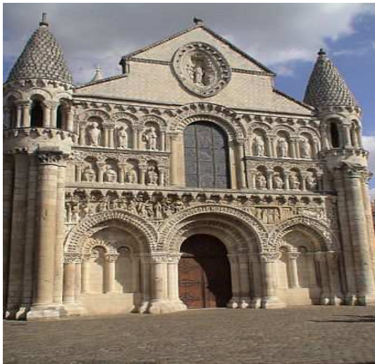
Slika 8: Katedrala Notre Dame la Grande , u Poatjeu, sagrađena 1150. godine

Na sledećim slikama vidimo primjere romaničke arhitekture. Katedrala Notre Dame la Grande u francuskom gradu Poatjeu je najstarija romanička katedrala u Evropi. Kod nas, primjer najranijeg spomenika zrele romanike je, kao što je već rečeno, katedrala sv. Tripuna u Kotoru.