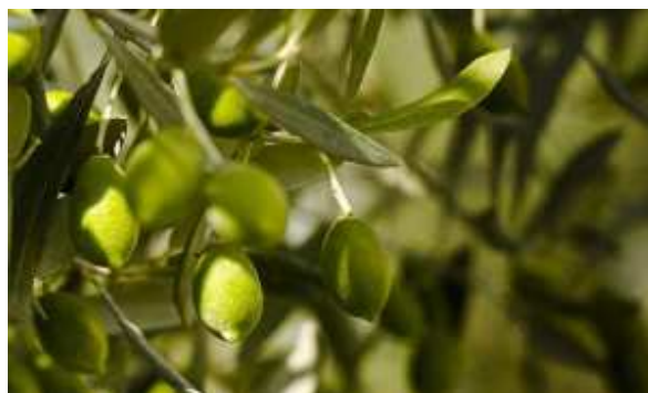
Slika broj 38: Masline