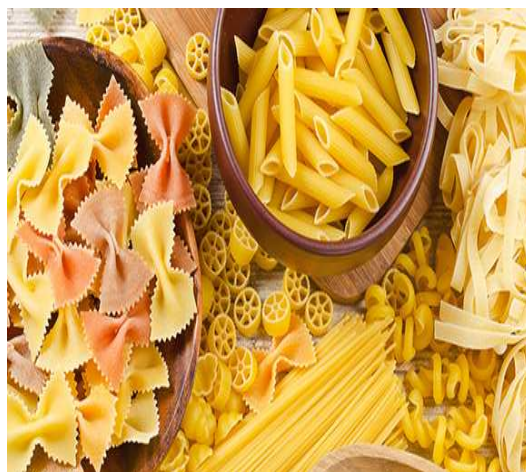
Slika 25: Tipične vrste Veneto tjestenine