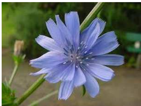
Slika broj 41: Cvijet žučenice

Od autohtonih vrsta biljaka, koje rastu u Crnoj Gori, svakako treba pomenuti i žučenicu, koja spada u eko proizvode i u posljednje vrijeme sve više je popularna. Žučenica fest, koji se svake godine održava u Tivtu, okuplja brojne goste, kako domaće tako i strane, s ciljem degustiranja specijaliteta koji se prave od ove biljke i obogaćenja turističke ponude. Žučenica fest je našla svoje mjesto u poznatim gastronomskim časopisima nekoliko zemalja. U prospektima turističkih organizacija iz Švedske, Rusije, Poljske, Mađarske, Italije našla se Žučenica fest. 140