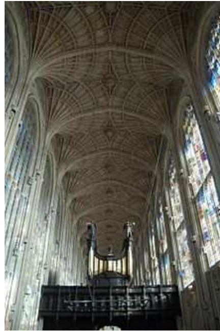
Slika 15: Lepezasti svod Kraljevskog Univerziteta u Kembridžu iz perioda od 1508.-1515. god.

Izvor: https://www.google.me/search?q=palata+drago Izvor: https://hr.wikipedia.org/wiki/Goti%C4%8Dka_arhitektura