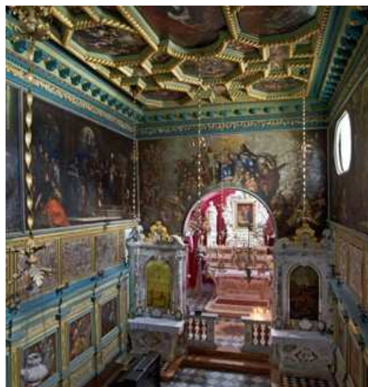
Slika 17: Unutrašnjost crkve Gospa od Škrpjela