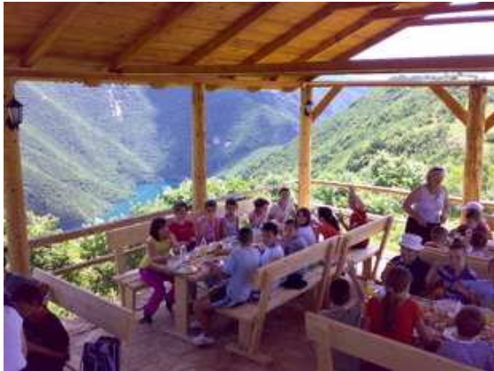
Slika broj 50: Terasa sa pogledom na kanjon Pive