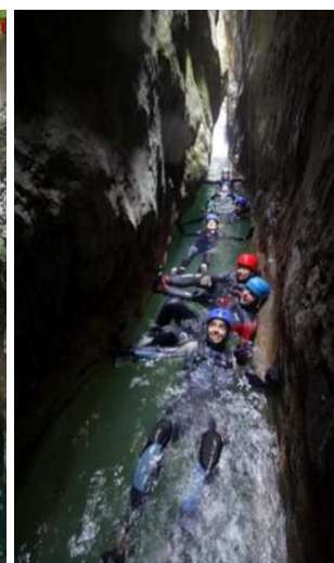
Slike broj 46 i 47: Kanjon Nevidio