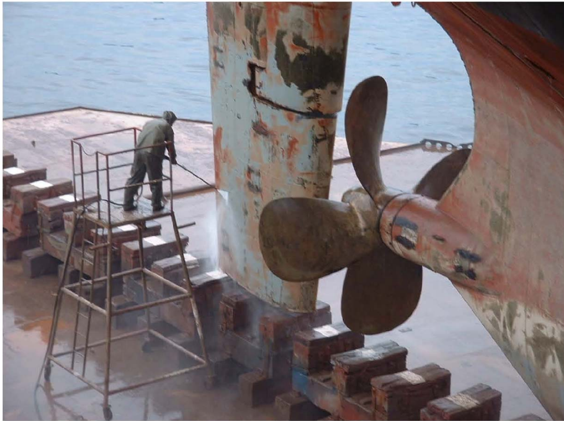
Mokra priprema kormila broda