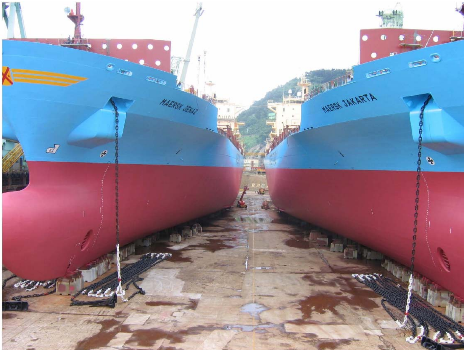
Razvlačenje broskog lanca