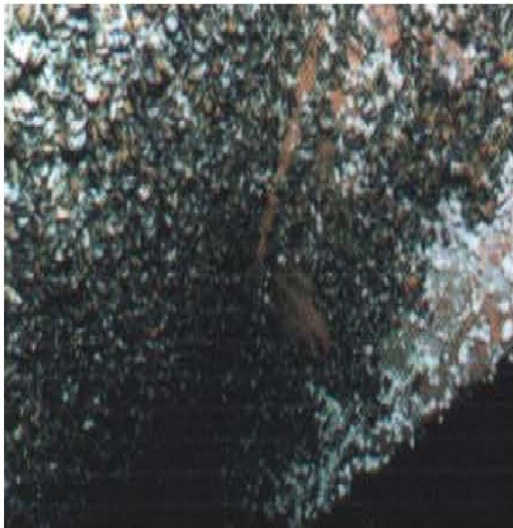
Morski žir i drugi školjkaši