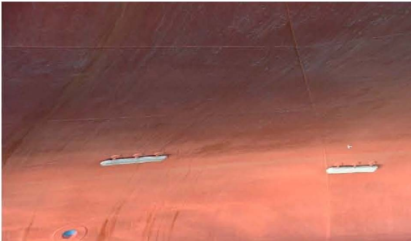
Cinkove anode na oplati broda