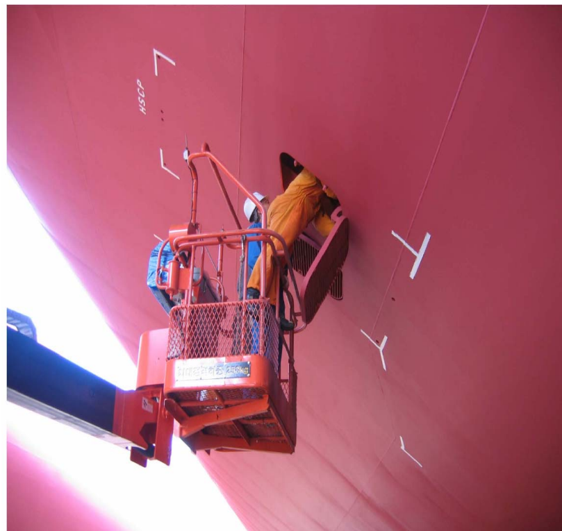
Kutije usisa brodskog motora