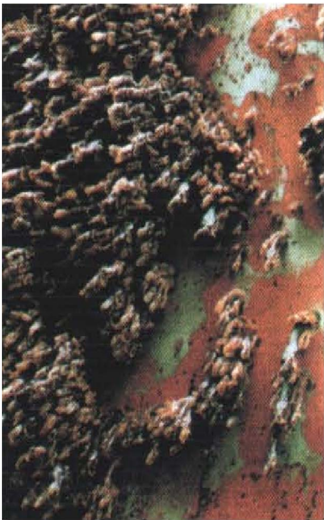
Vanjska oplata broda obrasla školjkašima