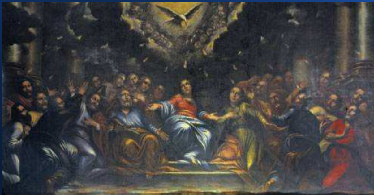
Tripo Kokolja Silazak Duha Svetoga Gospa od Škrpjela

Tripo Kokolja je bio prvi domaći barokni slikar koji je djelovao u domaćoj sredini nakon niza stoljeća isključivog uvoza slika iz Venecije