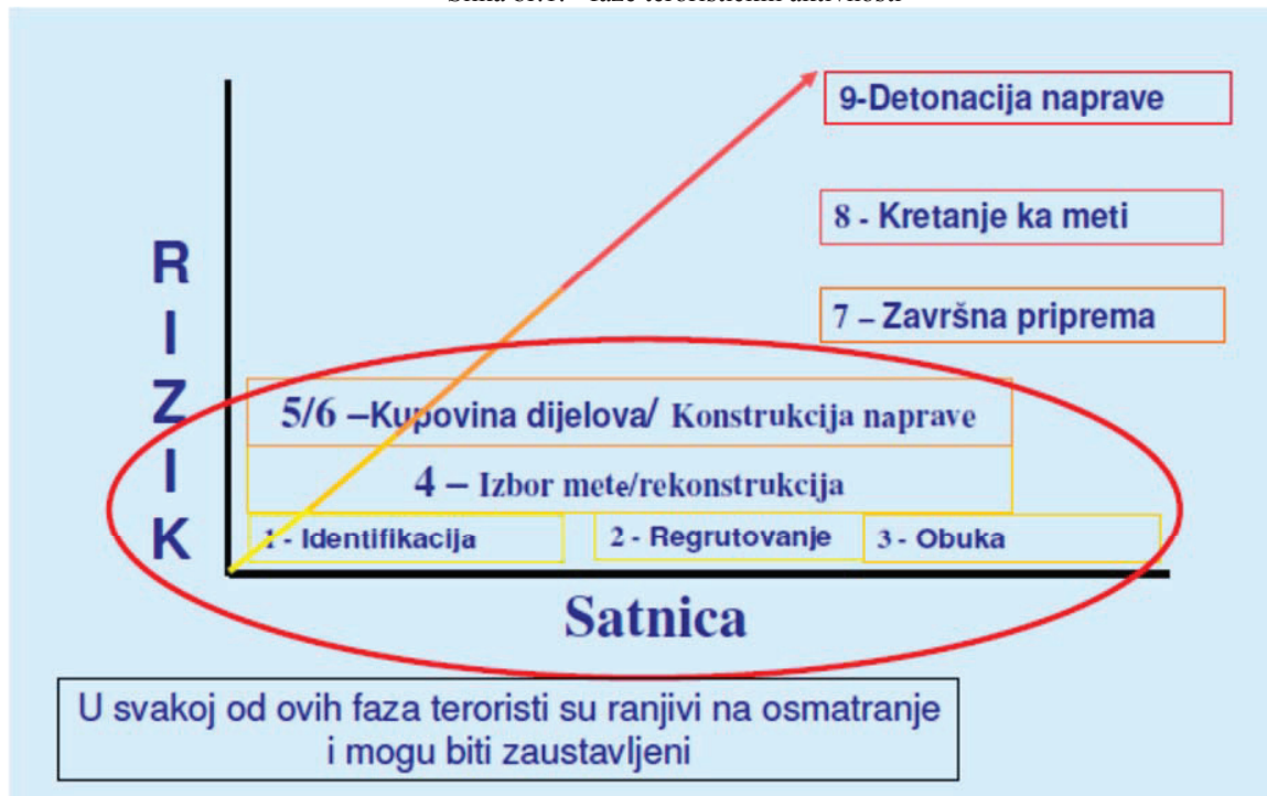
Slika br.1. - faze terorističkih aktivnosti