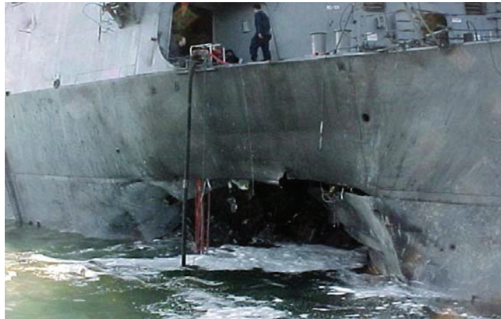
Slika br.2 . „Cole“ poslije terorističkog napada