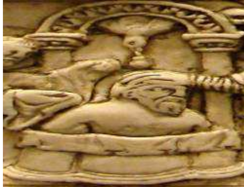
Slika br. 8: Pokršćavanje Hlodoveha, osnivača Franačke države 48

održavali sajmovi i vremenom su tu nicala i stalna naselja. Pored privrede, manastiri su bili i kulturna središta sa školama i bibliotekama. Starešna manastira na Istoku se zvao Iguman, a na Zapadu Opat. Varvari su bili pagani koji su pljačkali i palili hrišćanske hramove. Franački vladar Hlodoveh prvi je vladar u državi koji je primio hrišćanstvo, nakon čega je ojačao svoju vlast, sa Crkvom kao saveznikom. Franački vladari pomogli su i osnivanje Papske države na Apeninskom poluostrvu.