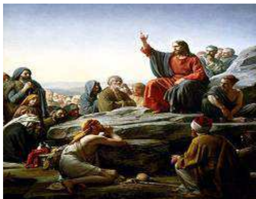
Slika br. 1: Beseda Isusa Hrista na gori od Karl Hajnrh Bloha (Carl Heinrich Bloch), Danski slikar, 1890. 11