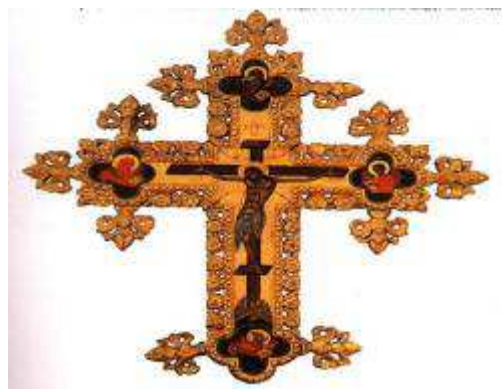
Slika br. 11: Najrašireniji simbol hrišćanstva danas u upotrebi je krst 98

„1. Verujem u jednoga Boga Oca, Svedržitelja, Tvorca neba i zemlje i svega vidljivog i nevidljivog. 2. I u jednoga Gopoda Iusa Hrista, Sina Božijeg jedinorodnog, od Oca rođenog pre svih vekova; Svetlost od Svetlosti, Boga od Boga istinitog; rođenog a nestvorenog, jednosušnog Ocu, kroz koga je sve postalo; 3. Koji je radi nas ljudi i radi našeg spasenja sišao s nebesa, i ovaplotio se od Duha Svetoga i Marije Djeve, i postao čovek; 4. I Koji je raspet za nas u vreme Pontija Pilata, i stradao i bio pogrben 5. I Koji je vaskrasao u treći dan, po Pismu; 6. I Koji se vazneo na nebesa i sedi sa desne strane Oca; 7. I Koji će opet doći sa slavom, da sudi živima i mrtvima, Njegovom carstvu neće biti kraja; 8. I u Duha Svetoga, Gospoda, životvornog, Koji od Oca ishodi, Koji se sa Ocem i Sinom zajedno poštuje i zajedno slavi, Koji je govorio kroz proroke; 9. U jednu Svetu, Sabornu i Apostolsku Crkvu 10. Ispovedam jedno krštenje za oproštenje grehova, 11. I čekam vaskresenje mrtvih, 12. I život budućeg veka. Amin! 97