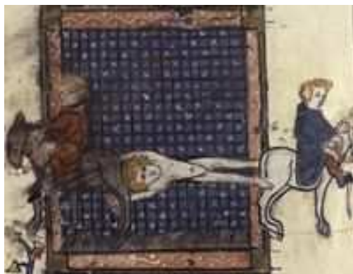
Slika br. 4: Mučeništvo Ipolita Rimskog, francuska minijatura iz 14. veka. 41

Prvi veliki progon hrišćana je započeo pod carem Neronom. Godine 64. je izbio veliki požar u Rimu. Neron je za podmetanje požara koji je uništio veliki deo grada optužio hrišćane i započeo progone protiv njih. Za vreme ovog gonjenja, Hristovi sledbenici su razapinjani na krst, bacani u Tibar i predavani divljim zverima u amfiteatru, radi uveseljavanja rimskih građana. Među ovim prvim mučenicima nalazili su se i apostoli Petar i Pavle, koji su pogubljeni 67. godine. Hrišćani koji su bili rimski državljani kažnjavani su odsecanjem glave, dok su oni bez građanskog statusa uglavnom kažnjavani spaljivanjem. Mnogi hrišćani su tada bili razapeti i živi spaljeni u Neronovoj bašti, kao ljudske buktinje. Posle kratkog perioda zatišja počeli su novi progoni za vreme cara Domicijana.