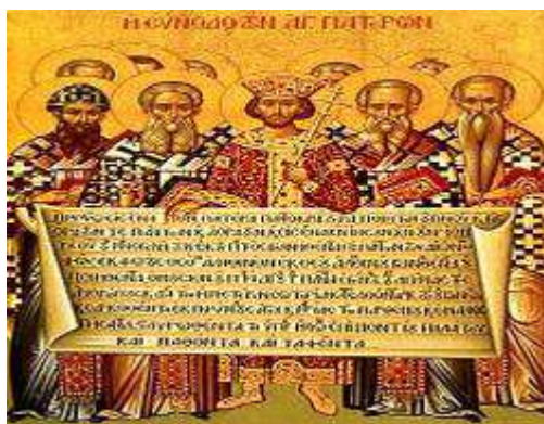
Slika br. 12: Car Konstantin i crkveni oci drže Nikejski Simbol Vere, savremena pravoslavna ikona. 104

Konstantin je ostvario crkveno jedinstvo proteravši iz zemlje sve episkope koji nisu hteli da potpišu novostvoreni Simbol Vere. Arije je raščinjen, proglašen jeretikom, proklet i prognan u Ilirik, zajedno sa njegovim pristalicama. Kako je Car proglasio odluke Sabora carskim zakonima, priklanjanje Ariju je od tada postalo zločin, a Arije je postao državni neprijatelj. Vlasnici njegovih knjiga su pod pretnjom smrtne kazne bili prisiljeni da ih predaju. Smatralo se da će na taj način arijanstvo biti potisnuto, ali ispostavilo se da je nasilje imalo upravo suprotno dejstvo. Samo održavanje Sabora, kao i njegov tok i zaključci, doveli su do određenih kritika. Često se napominje da, iako je predsedavao hrišćanskim Saborom, car Konstantin tada još uvek nije bio kršten. Prema kasnijem crkvenom predanju, kršten je neposredno pred smrt.