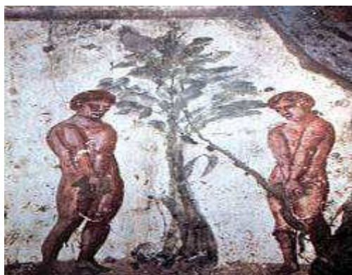
Slika br. 9: Adam i Eva, detalj kompozicije Postanje, ranohrišćanske freske iz rimskih katakombi ispod crkve Svetih Marcelina i Petra. 50

Gnostici, od grčke reči: gnosis – znanje, su bili hrišćani koji su hteli teološke dogme misaono istraživati. Oni su, pored vere, naglašavali i važnost saznanja o duhovnim stvarima. Protiv gnostika su istupali crkveni apologeti koji su zahtevali verovanje koje ne proishodi iz znanja. „Odnos prvih „crkvenih otaca“ prema gnosticima sličan je u izvesnoj meri odnosu velikih grčkih filozofa prema sofistima: gnosa je privid prave veronauke, gnosa je opasna jeres (haireisis = skretanje, naklonost). Apologeti (branioci prave hrišćanske vere) optuživali su gnostike za potpadanje pod loš uticaj „neznabožačke grčke filozofije“. 51 Gnostici su bili okrenuti duhovnom istraživanju i oni su u hrišćanstvo uneli mnoge sadržaje iz istočnih filozofija i mitova. Kada je hrišćanstvo postalo zvanična religija Rimskog carstva, gnosticizam je iskorenjen, a uspeo je preživeti jedino izvan granica Carstva, na područjima Azije. Sa Bliskog Istoka i Azije je uglavnom potisnut širenjem islama, iako su neke manje zajednice na teritoriji Iraka i Irana uspele da opstanu do danas.