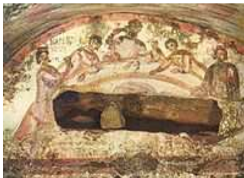
Slika br. 3: Gozba ljubavi (agape), rana freska iz rimskih katakombi. 38

Hrišćani su odbacivali kult Cara, zbog čega su često bili podvrgnuti dugotrajnim i okrutnim progonima od strane careva Rimskog carstva. Zato su se rani hrišćani okupljali u podzemlju, po katakombama, gde je nastala i rana hrišćanska umetnost. Među svečanim proslavama koje su rani hrišćani upražnjavali u katakombama, bile su i gozbe ljubavi – Agape, običaj zajedničkog deljenja hrane i pića, što je kasnije zamenjeno euharistijom, koja je uključivala simboličnu količinu hleba i vina. Među prvobitnim hrišćanima nije bilo manastira, monaštva niti pustinjaštva, jer tada su svi hrišćani upražnjavali moralnu strogost, koja će kasnije postati odlika uglavnom monaha.