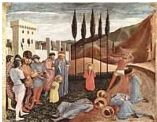
Slika br. 5: Fra Anđeliko, Mučeništvo Kozme i Damjana, danas u pariskom muzeju Luvr. 42

Prvi veliki progon hrišćana je započeo pod carem Neronom. Godine 64. je izbio veliki požar u Rimu. Neron je za podmetanje požara koji je uništio veliki deo grada optužio hrišćane i započeo progone protiv njih. Za vreme ovog gonjenja, Hristovi sledbenici su razapinjani na krst, bacani u Tibar i predavani divljim zverima u amfiteatru, radi uveseljavanja rimskih građana. Među ovim prvim mučenicima nalazili su se i apostoli Petar i Pavle, koji su pogubljeni 67. godine. Hrišćani koji su bili rimski državljani kažnjavani su odsecanjem glave, dok su oni bez građanskog statusa uglavnom kažnjavani spaljivanjem. Mnogi hrišćani su tada bili razapeti i živi spaljeni u Neronovoj bašti, kao ljudske buktinje. Posle kratkog perioda zatišja počeli su novi progoni za vreme cara Domicijana.