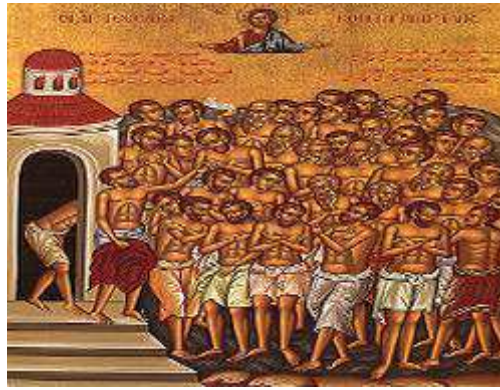
Slika br. 6: Četrdeset mučenika u Sevasteji, pravoslavna ikona. 43

Najveće progone hrišćanstvo je doživelo za vreme Dioklecijana, od 284. – 311. i njegovih saradnika i savladara, naročito Galerija, koji je vladao od 305. – 311. i Maksimijana, koji je bio na vlasti od 286. – 305. Po svom obimu i surovosti ovo je bilo najsurovije gonjenje koje je rimska država pokrenula protiv hrišćana. Država je pokrenula sve svoje institucije da bi iskorenila i uništila ovu veru. Ipak, uvidevši svu besmislenost i uzaludnost progona hrišćana, car Galerije je sa smrtničke postelje izdao Edikt o prekidu gonjenja hrišćana, pod uslovom da hrišćani budu lojalni državi i da se mole svom Bogu za cara. Međutim, iako u manjem intenzitetu, progoni hrišćana su i dalje nastavljeni, posebno u udaljenim oblastima Carstva. Tako je za vreme cara Licinija, 320. godine pogubljeno četrdeset vojnika rimske legije u Sevastiji koji su otvoreno ispovedali hrišćansku veru. 44