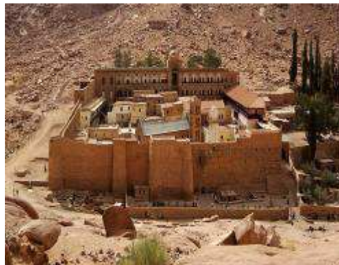
Slika br. 7: Manastir sv. Katarine, Sinajska Gora 47

Monaški pokret je započeo u Egiptu u četvrtom veku i njegovi su osnivači bili Kopti. Začetnici monaštva su bili Antonije Veliki, Pavle Tivejski, Pahomije i Ava Amun u egipatkoj pustinji. Iz Egipta se monaštvo brzo proširilo u Palestinu, Siriju, Mesopotamiju, Malu Aziju i dalje u Italiju. Monaštvo nije započelo kao ustanova ili institucija Crkve, već je bilo stihijska i sporadična pojava. Manastiri su u početku od strane crkvenih i svetovnih vlasti smatrani za pojavu koja deluje izvan zvaničnih institucija i postojala je tenzija između crkvenog klera i monaških zajednica. Vremenom je crkva prihvatila pojavu monaštva i počela da diže manastire. Ali pojedini monasi su odlazili i iz manastirskih zajednica, jer su i one ipak bile u dodiru sa svetom.