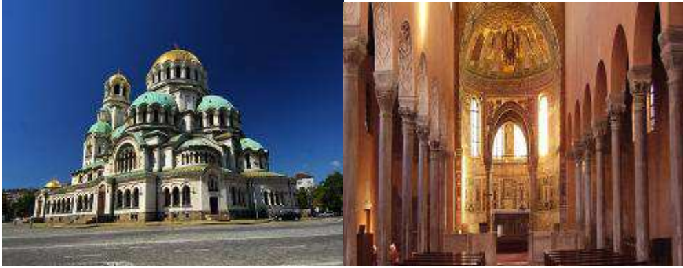
Slika br. 13: Aja Sofija 130 Slika br. 14: Eufrazijeva bazilika 131

Justinijan se trudio i oko sređivanja odnosa u Crkvi, tj. prevladavanju razlika između Zapada i Istoka u crkvenim pitanjima. U njegovo vreme sukob je izbijao zbog teološkog pitanja Hristove prirode, jer na Istoku je bilo mnogo pristalica tzv. monofizitske teorije, koji su tvrdili da Hrist ima jednu prirodu – samo božansku, drugim rečima Hrist nije pravi čovek. Pravoverna pozicija je tvrdila da Hrist ima dve prirode – jednu božansku i jednu ljudsku, tj. da je Hrist je i pravi Bog i pravi čovek. Da bi dokazao svoju privrženost zapadnom, odnosno latinskom hrišćanstvu, Justinijan je pokrenuo niz žestokih progona monofizita u Siriji i Egiptu. Ti progoni u velikoj meri su odredili buduća događanja na tom području, jer su monofiziti raširenih ruku prihvatiti islamske osvajače, koji su im garantovali slobodu ispovedanja svoje vere.