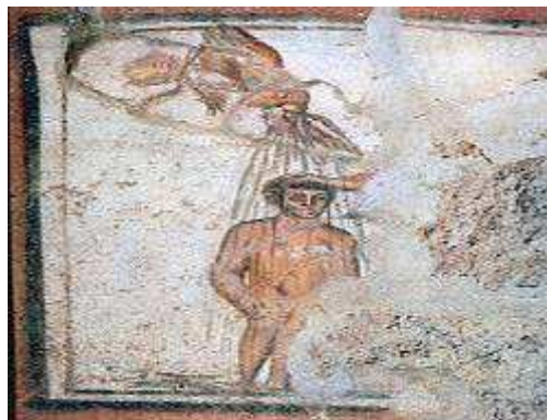
Slika br. 2: Krštenje, ranohrišćanska freska iz katakombi u Rimu. 35

Oni „behu postojani u nauci apostolskoj, u zajednici, i u lomljenju hleba, i u molitvama. A svi koji verovahu behu na okupu i imahu sve zajedničko. I tekovinu i imanje prodavahu i razdavahu svima kako je kome bilo potrebno.“ 34