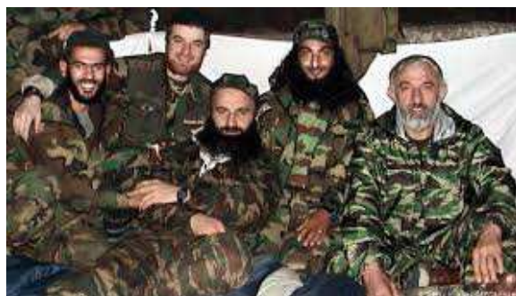
slika: Čečenski teroristi

Vjerski terorizam naročito je došao do izražaja na području Bliskog istoka. „Džihad“, sinonim za sveti rat, nije naziv samo jedne terorističke organizacije, već su ga nosile brojne islamske grupe. U Egiptu je najpoznatija organizacija „Muslimanska braća“, a od savremenih ističu se Hezbolah i Hamas.