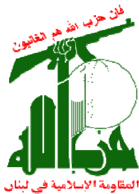
slika: zaštitni znak i pripadnici Hezbollaha

Hezbollah je proiranska organizacija, ili teroristička organizacija libanskih šita i njen osnovni cilj je borba za uspostavljanje šitske vlasti kalifata u Libanu, a kao metod borbe koriste se bombaši samoubice. Članstvo u organizaciji je doživotno, odnosno, može se istupiti iz organizacije jedino kroz smrt.