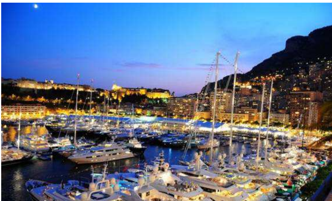
SLIKA1. Porto Montenegro – Boat Show

- Nautički turizam je specifični oblik turizma obilježen kretanjem turista plovilima po moru ili rijekama uključujući njihovo pristajanje u lukama i marinama i obuhvata svu infrastrukturu u lukama i marinama potrebnu za njihov prihvata. Prema prihodima koji se ostvaruju takvim kretanjima, nautički turizam je jedan od unosnijih oblika turizma za turistički receptivnu zemlju.