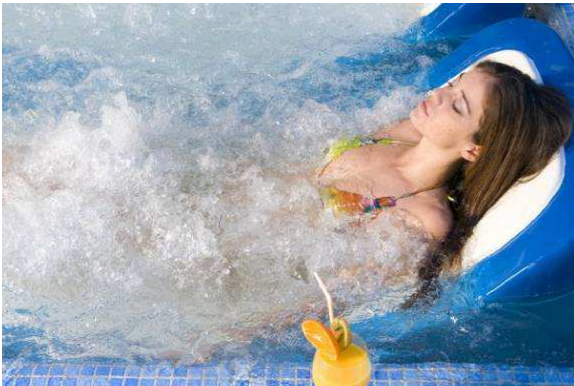
Slika 2. Talasoterapija (terapija u bazenu sa morskom vodom)

- talasoterapija – ovo je vrsta terapija koja je zasnovana na bazi tople morske vode u krajevima s blagom klimom –u specijalizovanim ustanovama ili slobodno. Temelji se na ljekovitom učinku blage primorske klime, zračenju sunčevih zraka i kupanja u mlakoj morskoj vodi . Talasoterapija u stvari zbog samog svoga sadržaja čini osnovu zdravstvenog turizma na moru.