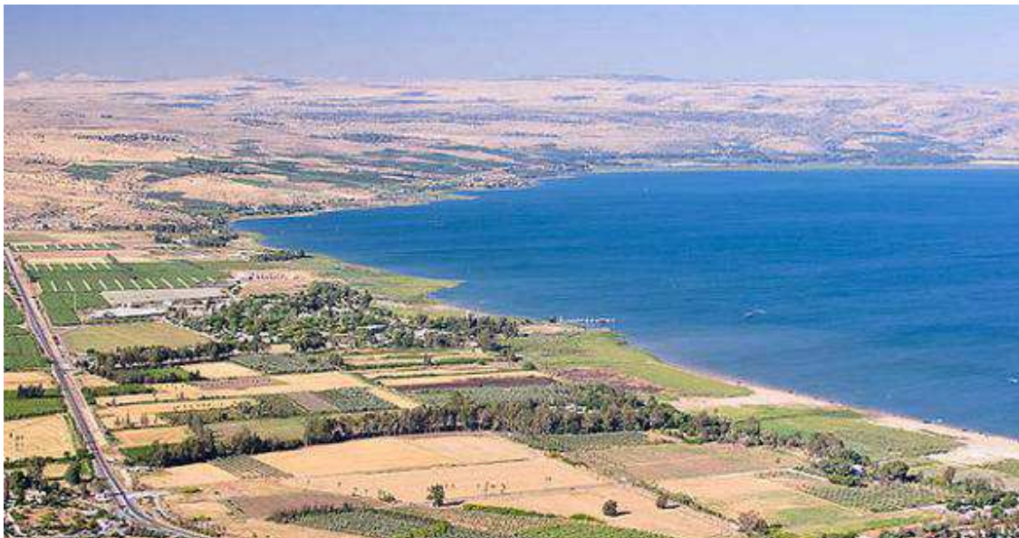
Slika 4. – Galilejsko jezero (Izrael)

Najpopularnija odredišta zdravstvenog turizma kada je Izrael u pitanju su čuvena lječilišta na Mrtvom moru i Galilejskom jezeru.