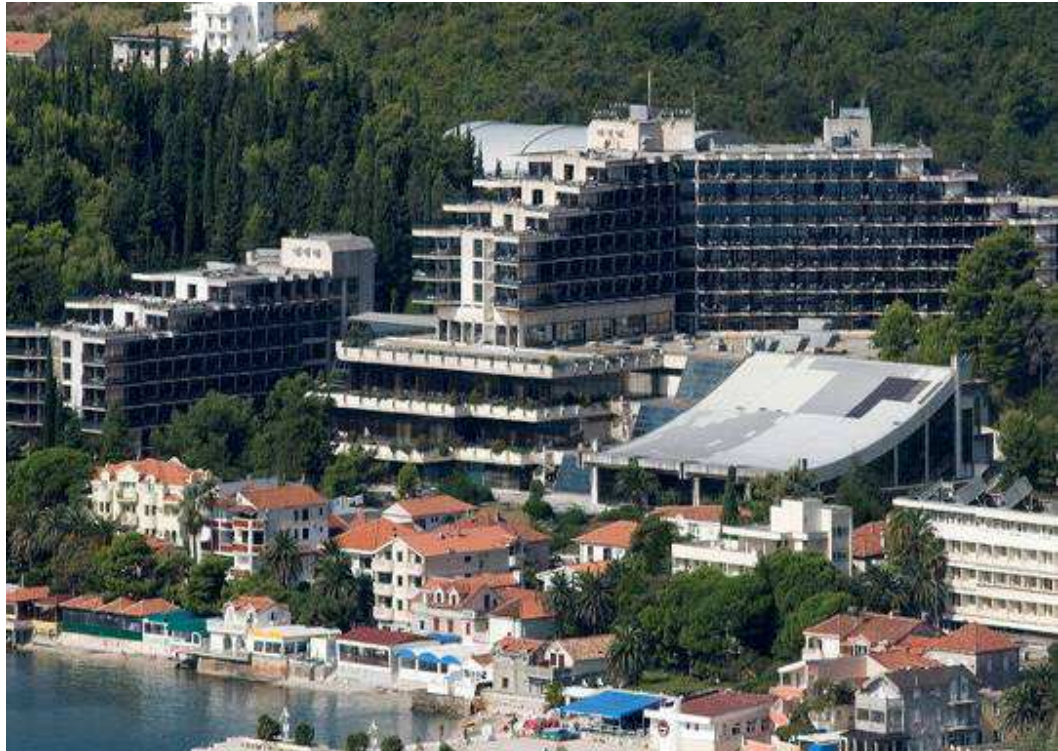
Slika 5. – Institut Dr. Simo Milošević (Igalo)

I dok sa jedne strane turistička atraktivnost lokacije i cijene mogu biti preporuka turistima za odabir Crne Gore kao destinacije zdravstvenog turizma, standardi zdravstvenih usluga, stručnost i oprema objekata koji ih pružaju nisu na adekvatnom nivou odnosno ne mogu za sad ni u kom slučaju konkurisati onima na Zapadu i u razvijenijim zemljama.