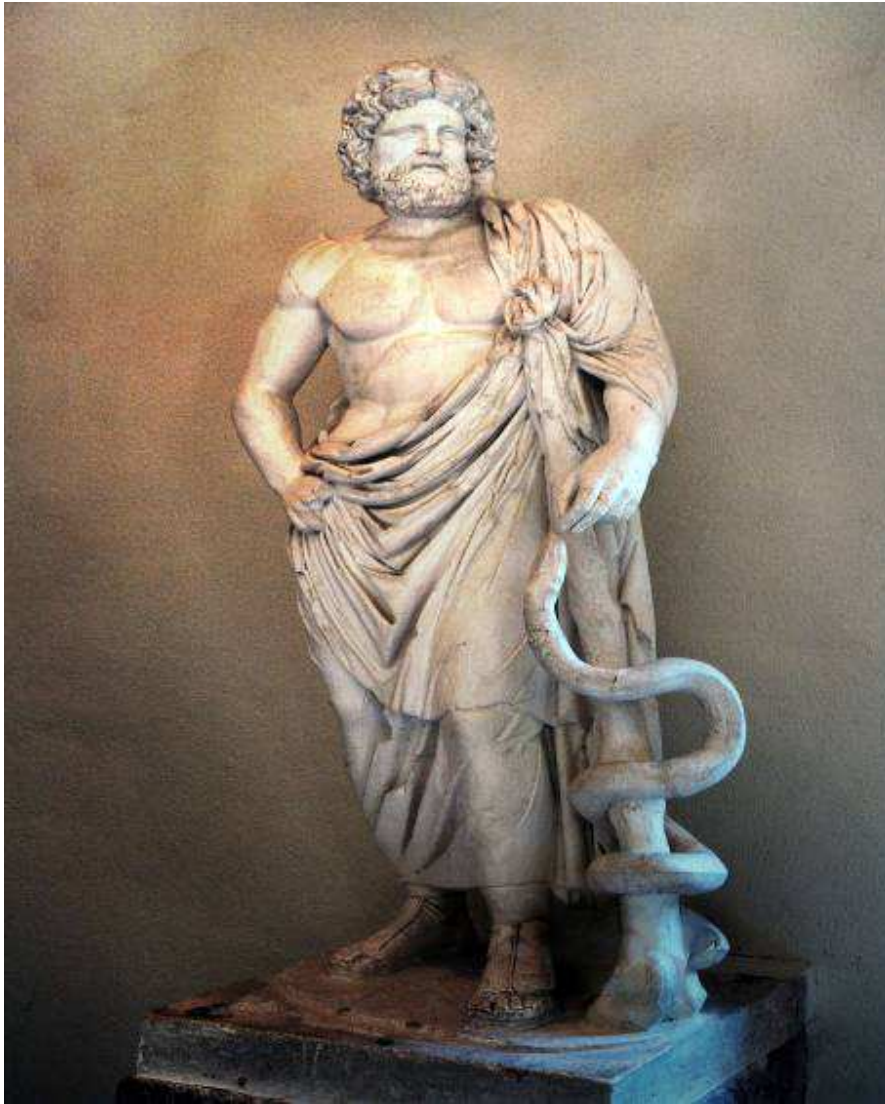
Slika 3 – Asklepios (Epidaurus) – Bog ozdravljenja

Viši, Aquae Sextiae – Eks an Provans (Aix-en-Provence), Aquae Sulis– Bat, a Aquae Mattiacae – Visbaden (Wiesbaden).